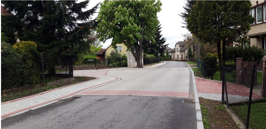
ul Bilczewskiego po przebudowie