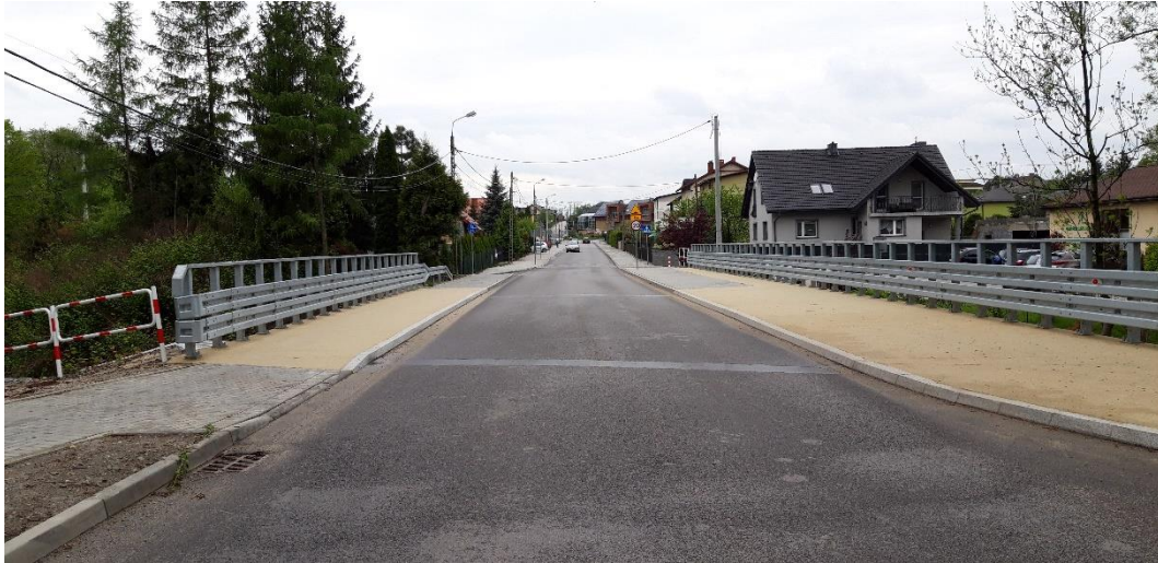
ul Pańska po remoncie – most i droga