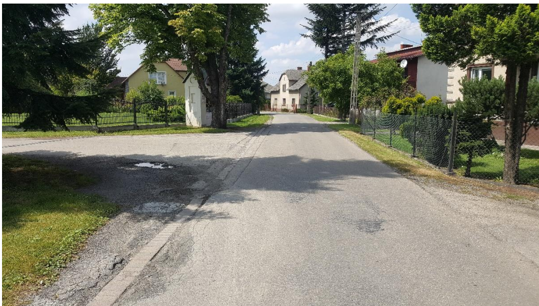
ul Bilczewskiego przed przebudową

Wartość zadania: 2.122.206,19 zł brutto przy udziale powiatu bielskiego.